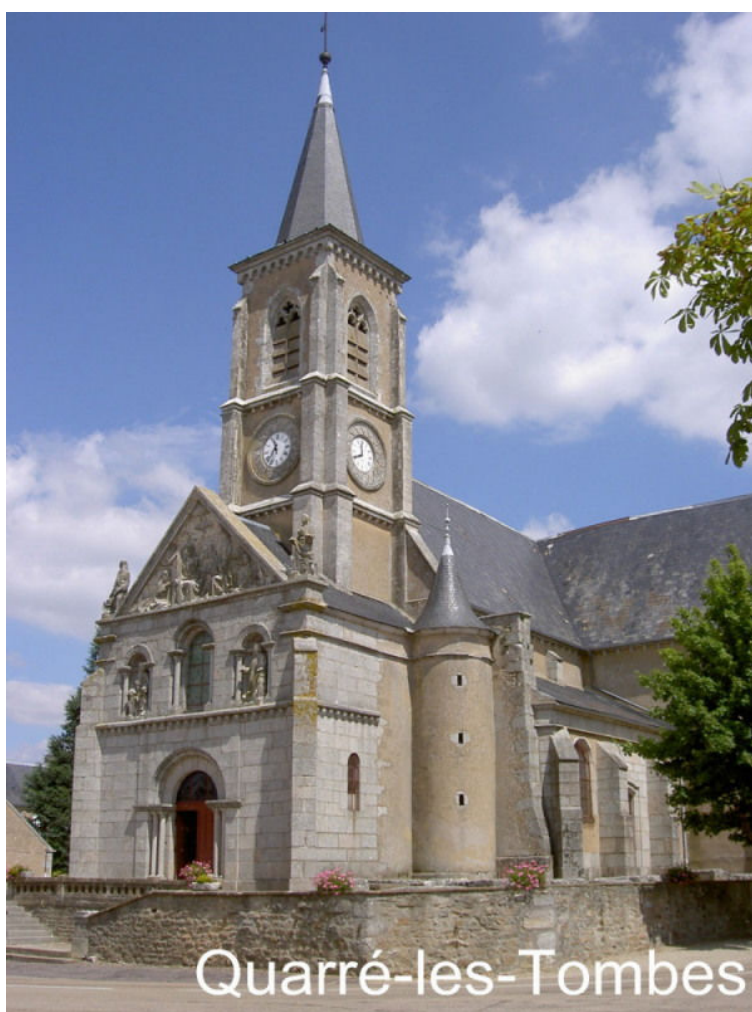
Photo : Église de Quarré-les-Tombes