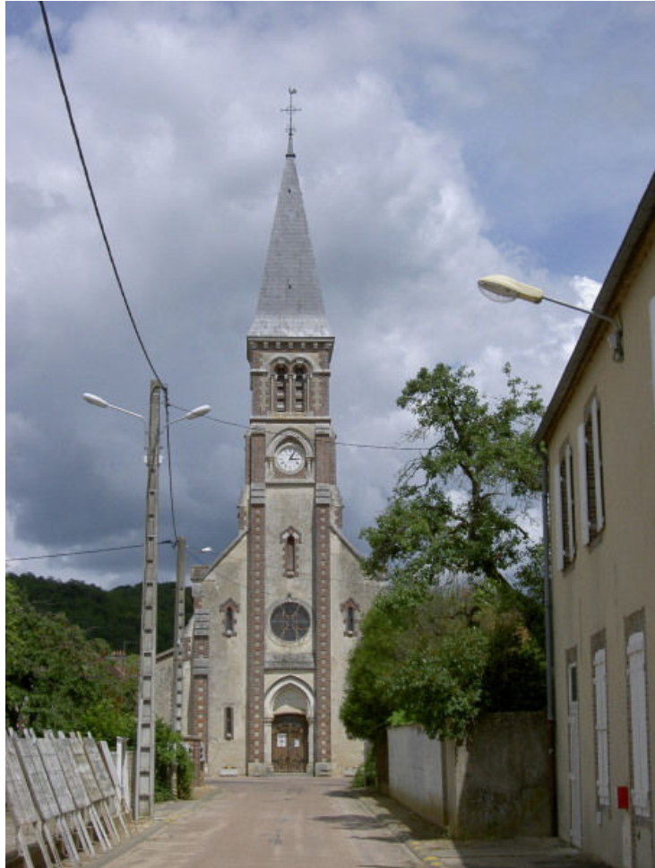
Photo : Église paroissiale d'Armeau

Revue DE LA SOCIÉTÉ GENÉALOGIQUE. DE L'YONNE