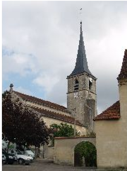
Photo : Église paroissiale d'Ancy-le-Franc

Revue DE LA SOCIÉTÉ GENÉALOGIQUE. DE L'YONNE