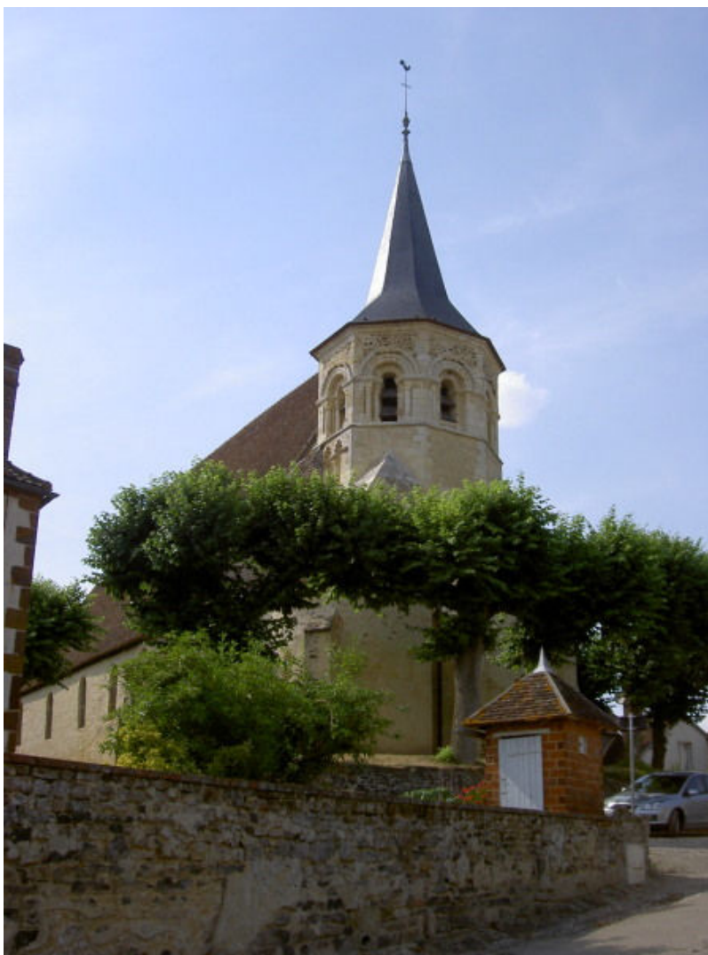
Photo : Église de Parly

Revue DE LA SOCIÉTÉ GENÉALOGIQUE. DE L'YONNE