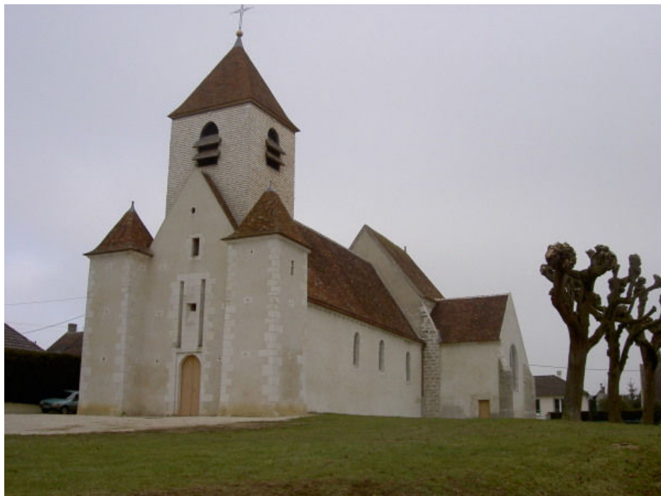
Église de Migennes

Revue DE LA SOCIÉTÉ GENÉALOGIQUE. DE L'YONNE