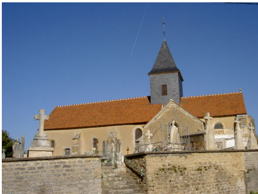
Photo : Église de Sceaux

Revue DE LA SOCIÉTÉ GENÉALOGIQUE. DE L'YONNE