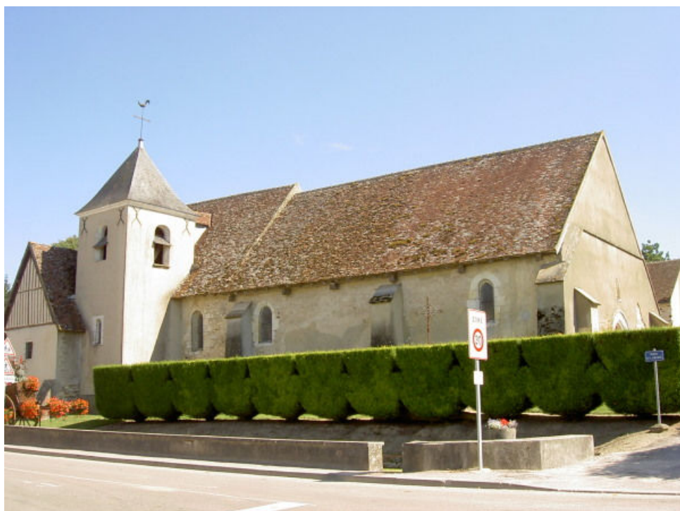
Photo : Église de Lindry