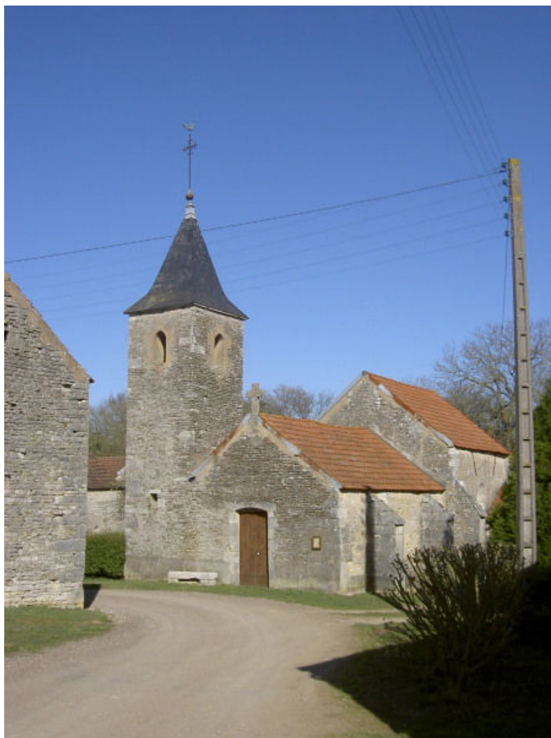
Photo : Église de Villiers-la-Grange

Revue DE LA SOCIÉTÉ GENÉALOGIQUE. DE L'YONNE