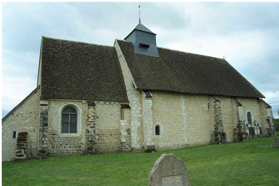
Église de Saint-Martin-sur-Ocre

Ils sont devenus Icaunais entre 1730 et 1740