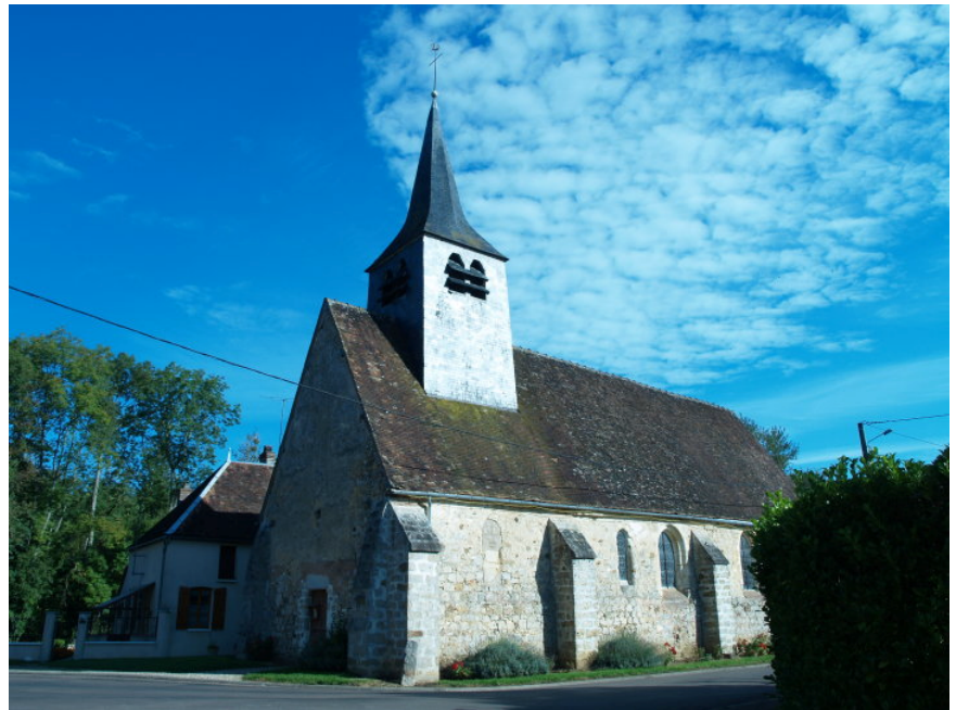
Photo : Église de Flacy

Famille Verger, de Levis Soldats de l'Empire Incendie aux Sièges