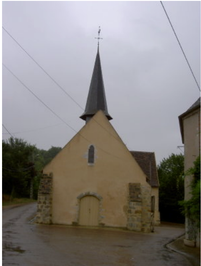
Photo : Église de Louesmes