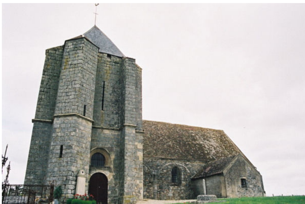
Photo : Église de Compigny

Revue DE LA SOCIÉTÉ GENÉALOGIQUE. DE L'YONNE